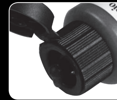
Cuentagotas / Eyedropper