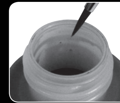
Boca ancha / Wide mouth